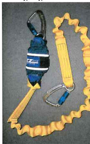
Typ / Type 1245540