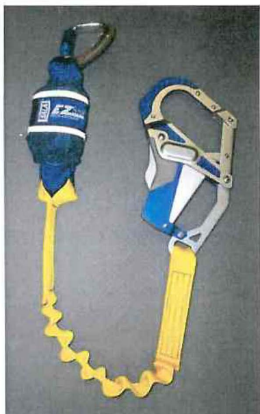
Typ / Type 1245577