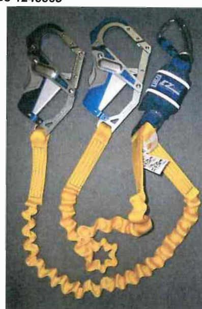
Typ / Type 1245576