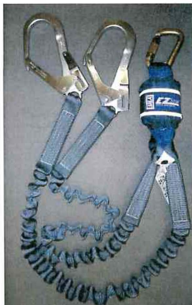
Typ / Type 1260316