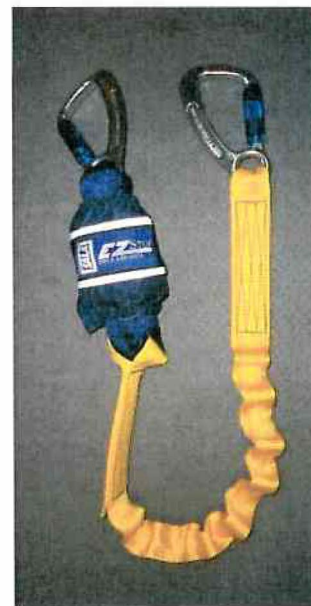
Typ / Type 1245536