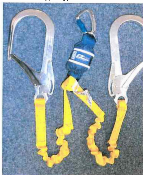
Typ / Type 1245564