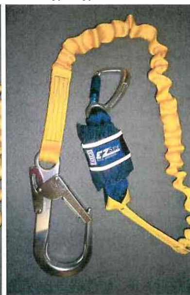
Typ / Type 1245541