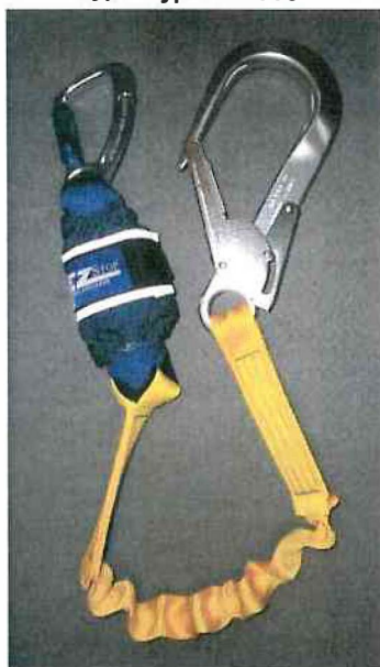
Typ / Type 1245537