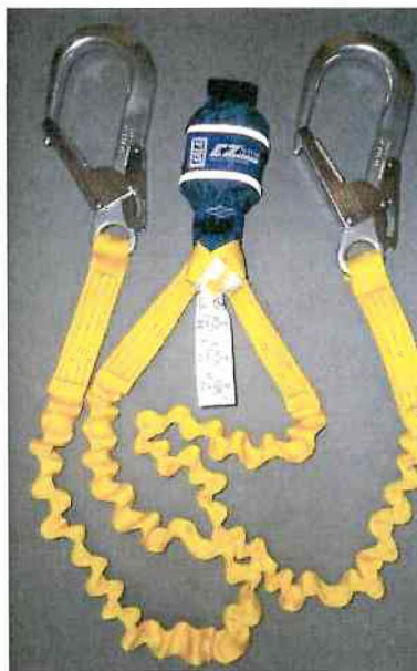
Typ / Type 1245535