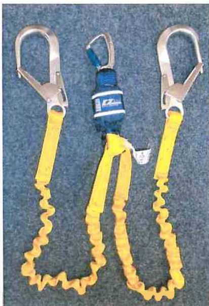
Typ / Type 1245534