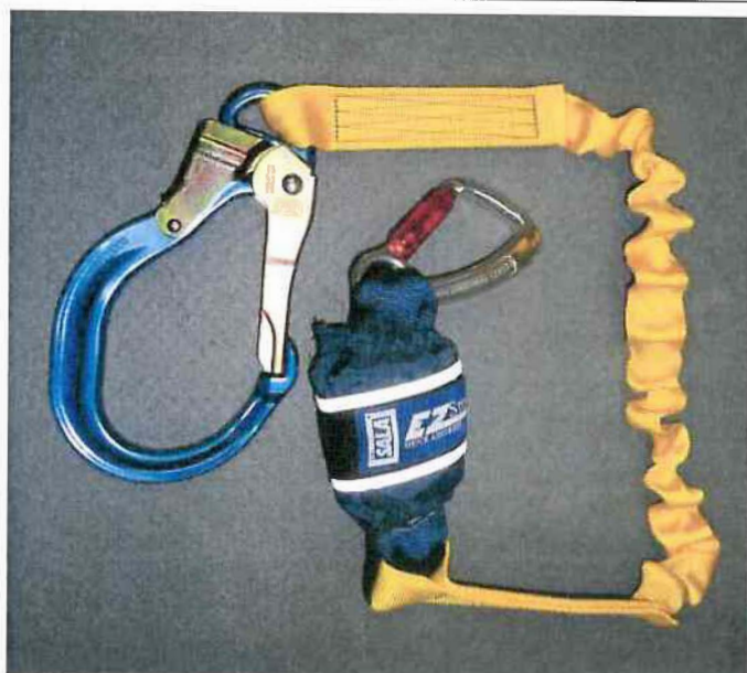
Typ / Type 1245563