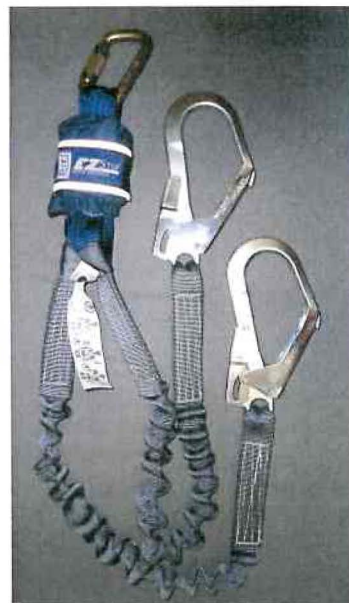
Typ / Type 1260320