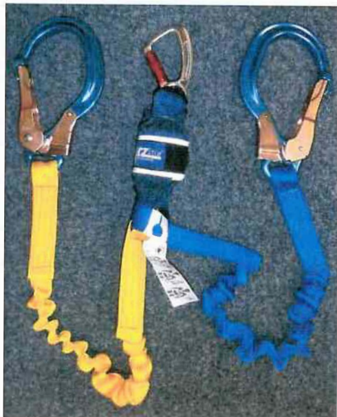
Typ / Type 1245562