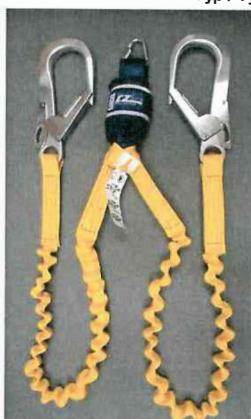
Typ / Type 1245575